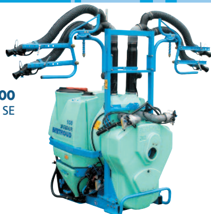
Speedair 400 boveda manual SE