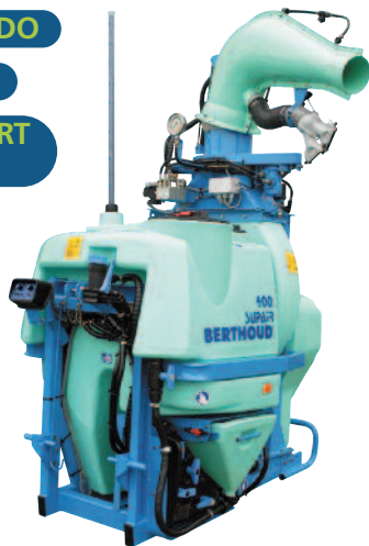
Speedair 400 con cánón oscilante