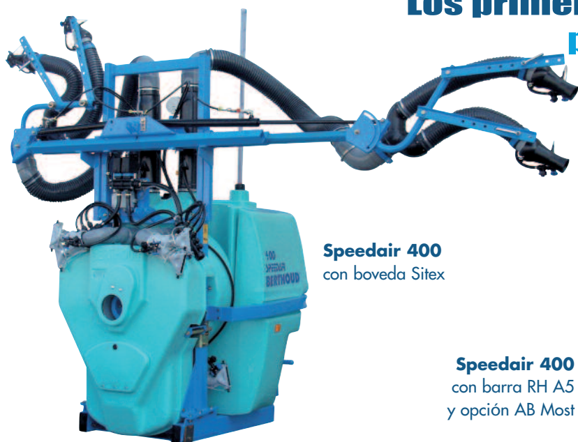
Speedair 400 con boveda Sitex